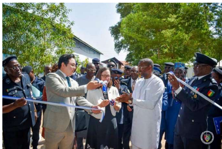
Le système MIDAS au cœur du dispositif

Dans une démarche de modernisation de sa gestion migratoire, la Guinée a franchi, ce mardi 7 avril 2026, une étape décisive. L'École Nationale de Police et de Protection Civile (ENPPC) de Kagbelen a inauguré une salle de formation de dernière génération, fruit d'un partenariat stratégique avec l'OIM et les États-Unis.