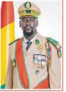
Le Général d'Armée Mamadi Doumbouya

N°8323 DU MARDI 23 SEPTEMBRE 2025 * 64 ème ANNÉE www.horoya.net - horoya 1958@gmail.com PRIX : 2000 GNF