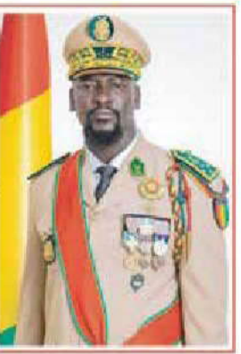
Le Général d'Armée Mamadi Doumbouya

"Notre voix résonne plus fort que jamais grâce à nos initiatives pour une coopération africaine et internationale plus intégrée et solidaire."